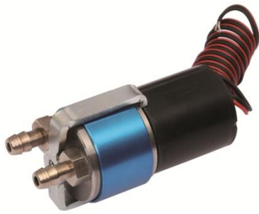
Abbildungen/Daten/Diagramme unverbindlich Illustrations/Dates/Graphs without engagement